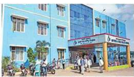
సంగారెడ్డిలోని మాతా శిశుసంరక్షణ కేంద్రం

ప్రైవేట్ లో ఇస్థానుసారంగా శస్త్రచికిత్సలు జిల్లాలో 92 ప్రైవేట్ ఆసుపత్రులు ఉన్నాయి.