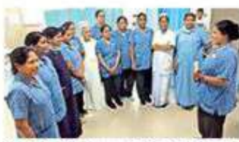
స్థానిక వైద్యారోగ్య సిబ్బందికి అధికారిక శిక్షణను ఇచ్చే సంగారెడ్డి జిల్లాలోని ఆసుపత్రికి చెందిన శిక్షకులు

మ్యూజి. సంగారెడ్డి ఆర్.ఎస్. జిల్లాలోని వైద్య విభాగ పరిషత్ ఆసుపత్రుల పరిధిలో సంగారెడ్డిలోని జిల్లా కేంద్ర ఆసుపత్రి, మహానెయి, నారాయణపేట్, వోగి పేట, అచారావర ప్రాంతీయ ఆసుపత్రులు ఉన్నాయి. జిల్లా వైద్యారోగ్య శాఖ పరిధిలో 29 ప్రాథమిక ఆరోగ్య కేంద్రాలు(పీహెచ్.ఆర్.సి) ఉన్నాయి. వీటిలోని 17 పీహెచ్.ఆర్.సి 24 గంటలపాటు సేవలు అందిస్తున్నాయి. ఐక 12 గంటలు పని చేసే పీహెచ్.ఆర్.సి 12 ఉన్నాయి. వీటిలోపాటు సరాసరి పేషెంట్లలోని సామాజిక ఆరోగ్య కేంద్రాలలోను ప్రసవాలు చేస్తున్నారు. సంగారెడ్డి జిల్లాకు ప్రభుత్వ ప్రాంతీయ జిల్లా కేంద్ర ఆసుపత్రికి ఉమ్మడి మెయింట్ జిల్లావారితో కాకుండా సమీపంలోని విజయవాడ, రంగారెడ్డి జిల్లాలకు చెందిన వారు వైద్యం కోసం వస్తుంటారు. జిల్లాలోని ప్రాంతీయ, సామాజిక ఆరోగ్య ఆసుపత్రుల నుంచి వైద్యం కోసం రోగులను, గర్భిణులను ఇక్కడికి పంపిస్తుంటారు. ముఖ్యంగా సంగారెడ్డి జిల్లా కేంద్ర ఆసుపత్రిలో సాధారణ కాన్పుల శాతం గణనీయంగా పెరిగింది. మరొక మెరుగైన పరిణామ కోసం హైదరాబాద్లో సాధారణ ప్రసవాలకు పేరెన్టీస్ వైద్యాలనేకం ఆసుపత్రికి చెందిన వైద్య నిపుణులతో ఇక్కడి సిబ్బందికి శిక్షణ ఇస్తుంటామని నిర్ణయించారు. ఆరు నెలలపాటు తప్పదు వైద్యాలనేకం ఆసుపత్రికి చెందిన ఐదేండ్ల నిపుణులతోపాటు 30 మంది మహిళా శిక్షకులు సంగారెడ్డికి వచ్చారు. నవంబరులో విజయవాడలో ఏర్పాటు...మొదటి 7లో